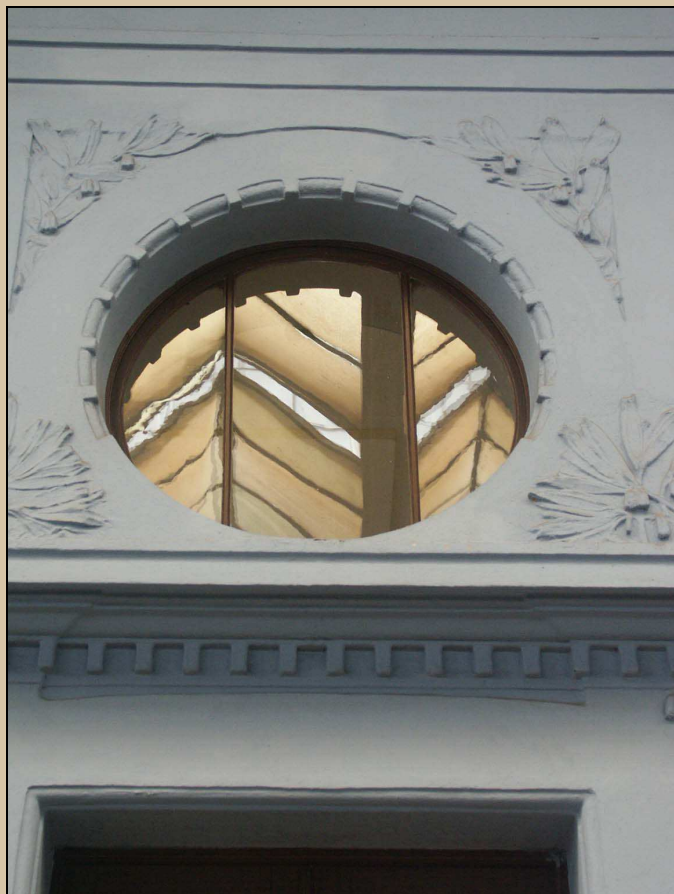
pohled na okno v nadsvětlíku z perónu